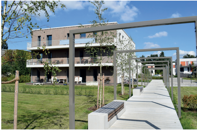
Wohnhaus am Kesselflickerweg (WaK)