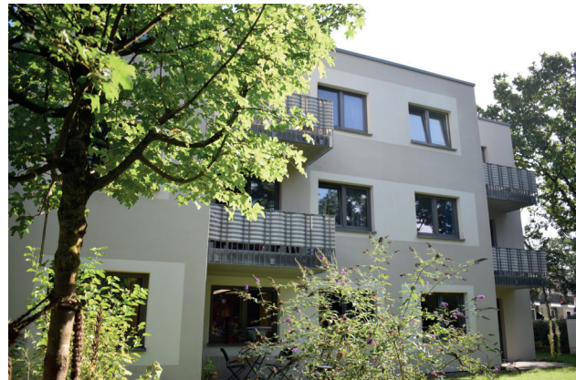
Wohnhaus am Buurredder (WaB)