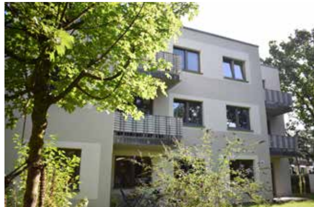
Wohnhaus am Buurredder