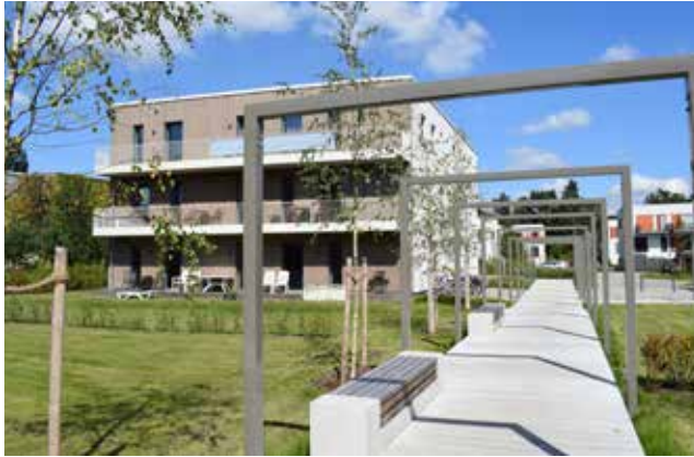
Wohnhaus am Kesselflickerweg